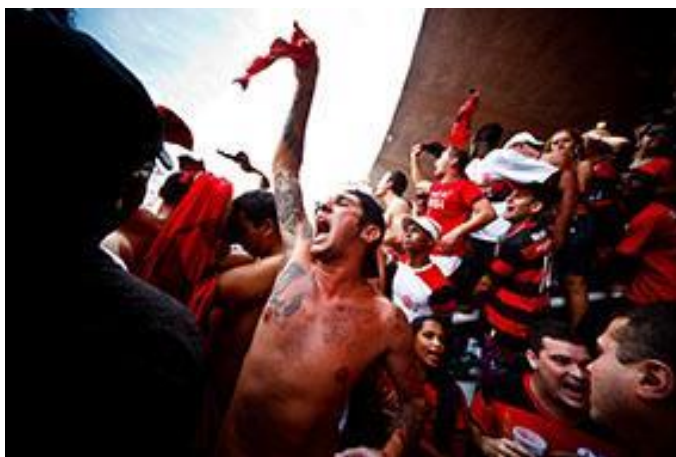
Figura 1: cena de Flamengo , de Gustavo Pellizzon (2009)

Para esse autor, é o que pode ser notado, por exemplo, no emblemático Flamengo , de Gustavo Pellizzon (2009). Atuando como fotojornalista na cobertura da final do campeonato brasileiro de futebol daquele ano, Pellizzon realizou um projeto que envolveu a mescla entre fotografia e vídeo e obteve considerável repercussão no meio jornalístico.