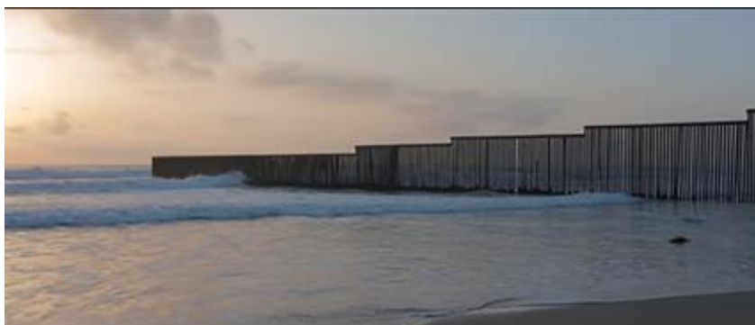
Figura 6: Um mundo de muros, cena do videodocumentário em torno da fronteira México/EUA. Fonte: UM MUNDO de Muros. São Paulo: Folha de S. Paulo, 2017. Disponível em < https://arte.folha.uol.com.br/mundo/2017/um-mundo-de-muros/ >. Acesso em 02 jun. 2019.