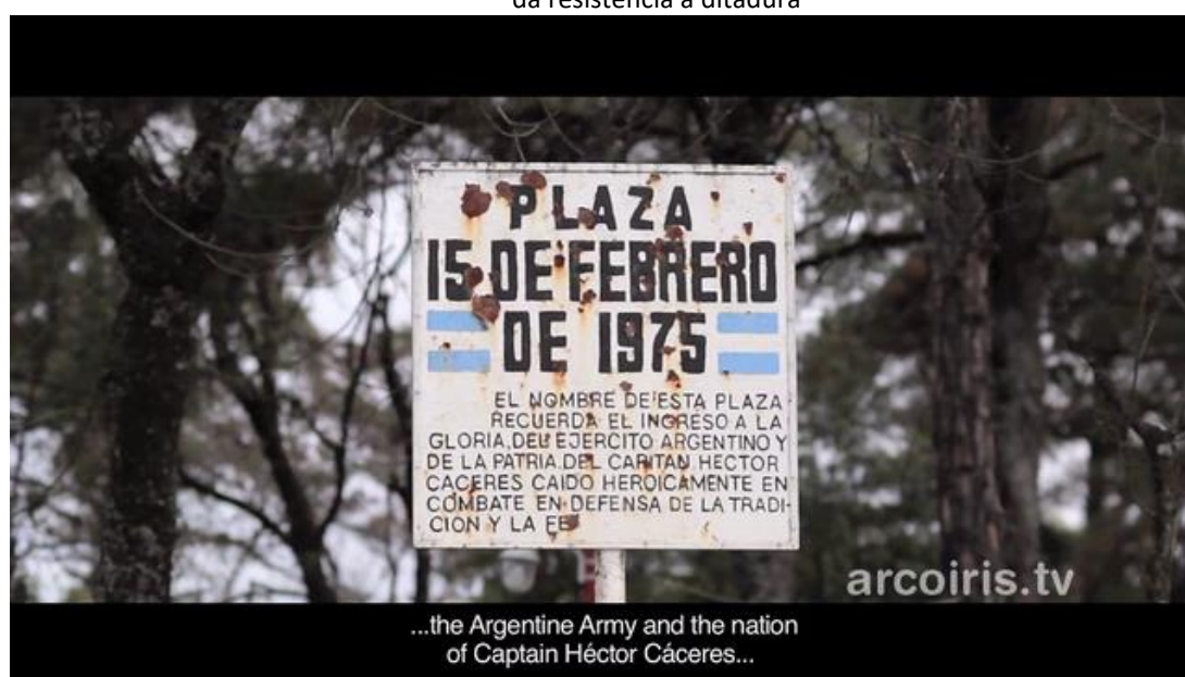
Figura 4 – Frame de Toponimia : monumentos à memória do terrorismo de Estado, produzidos para apagar a memória da resistência à ditadura

A presença simbólica não está apenas nas placas comemorativas, nos bustos, nos nomes e nas entradas dos vilarejos: a arquitetura militar das escolas, dos centros de lazer, a espacialidade, tudo isso também remete a instalações das Forças Armadas, inclusive com a sensação de que os espaços apresentados ali fazem parte do complexo militar do Campo de Mayo, um dos maiores centros de detenção clandestina e de tortura da ditadura militar argentina, investigado por Perel no filme Camuflaje (2022). O cineasta explora esses espaços em planos fixos e longos, que duram até um minuto. A experiência do tempo em Toponimia permite ao espectador transitar do presente para o passado inscrito naquelas imagens e circular por aqueles lugares, tornando-se ele também um arqueólogo em busca do que restou da ditadura no tempo presente.