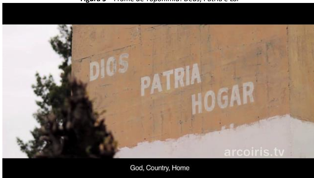
Figura 5 – Frame de Topinímia : Deus, Pátria e Lar

Evidentemente, Jonathan Perel não tinha como prever a ascensão de Javier Milei ao poder quando filmou Topinímia , durante o segundo mandato de Cristina Kirchner. No entanto, se defendo que cada paisagem/espço é feita de diferentes temporalidades e que as estratégias de montagem de cada cineasta fazem com que essas temporalidades se encontrem no tempo presente, projetando outros futuros possíveis, posso também defender que tais estratégias podem ser capazes de deixar pistas sobre as sombras que continuam a rondar.