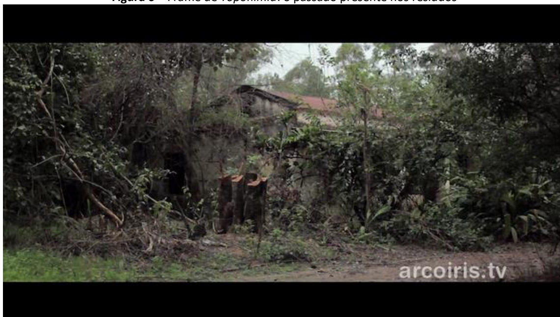
Figura 6 – Frame de Toponímia : o passado presente nos resíduos

Monumento à violência contra os camponeses, as paisagens em ruínas do epílogo dão seu testemunho sobre a desapropriação de terras para a Operação Independência (Figura 6). Os habitantes da zona rural de Tucumã jamais foram indenizados, foram obrigados a viver nos povoados construídos para manter a população sob o jugo do Estado, sofreram com prisões ilegais, torturas e também foram vítimas de desaparecimento forçado. É importante situar que a província de Tucumã foi palco de grande resistência da classe trabalhadora urbana e rural contra a ditadura, pois já era organizada politicamente, seja em sindicatos, seja em partidos, como é o caso do ERP. Mais de 50% das vítimas de prisão ilegal, tortura, sequestro e desaparecimento eram trabalhadores sindicalizados.