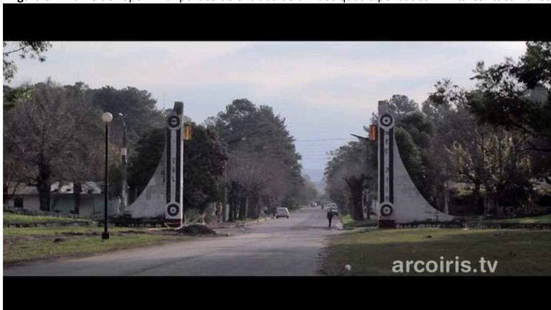
Figura 3 – Frame de Toponímia : pórtico de entrada de um dos quatro povoados “militares” tucumanos

A experiência de ter crescido em vilas militares torna Toponímia um filme muito familiar: a sensação de estar no Setor Militar Urbano, em Brasília, ou na vila militar de Marabá, no Pará, na região onde ocorreu a Guerrilha do Araguaia, é inevitável. Os pórticos de entrada, as torres de observação no meio da localidade (onde brincava quando criança, quando o guarda estava de folga) parecem ter saído da minha infância, assim como os sons dos cachorros latindo, das crianças brincando de bola, dos jogos de futebol dos adultos no campo da vila. Para mim, como espectadora, essa é uma paisagem familiar. A diferença é que, em Tucumã, os povoados foram construídos para civis viverem – mas dentro da mesma lógica (e da vigilância) militar.