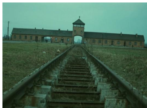
Fotograma de Shoah