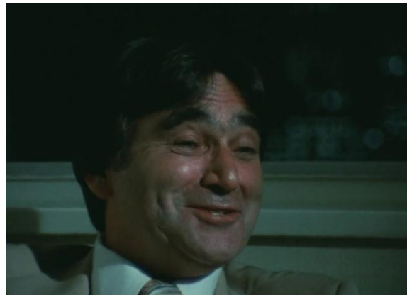
Rudolf Vrba (fotograma de Shoah )

Pero, desde el punto de vista de la puesta en escena, el binomio fundamental viene dado por la quiebra, suprimiendo uno de sus miembros, de la unidad audiovisual del protagonista. En efecto, el rostro parlante se desdobra en dos mitades: una faz silente (eso ocurre sobre todo cuando el aflorar de la experiencia traumática induce un estado de afasia y el silencio alcanza una expresividad superior a la del habla) y una voz en off sin presencia visual de su emisor.