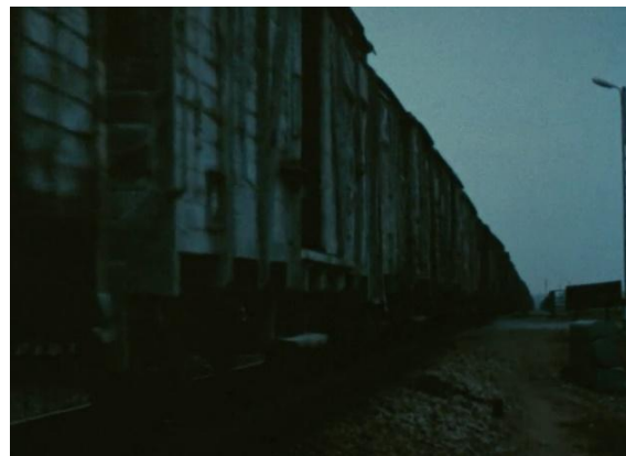
Final de Shoah