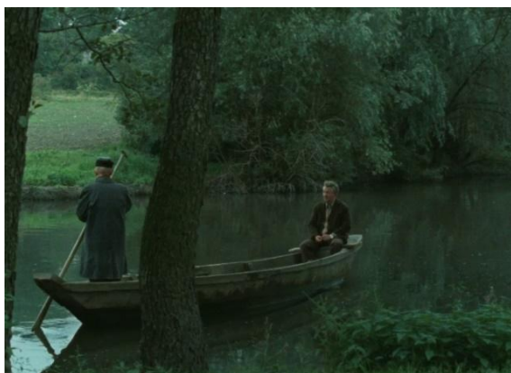
Início de Shoah