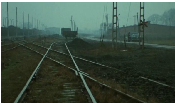
Fotograma de Shoah