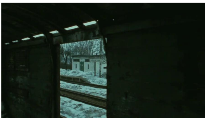
Fotograma de Shoah