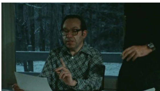
Raul Hilberg (fotograma de Shoah )